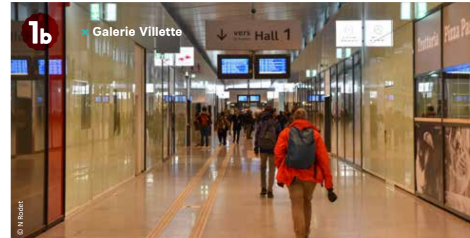
1b ✖ Galerie Villette