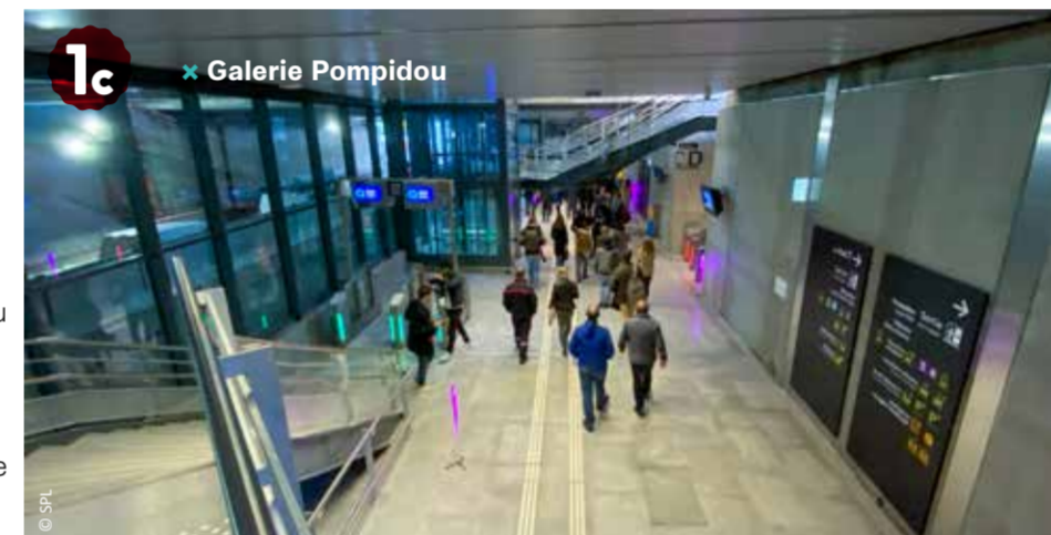
1c ✖ Galerie Pompidou