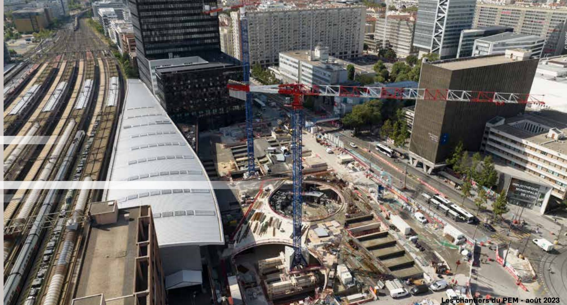
Les chantiers du PEM - août 2023