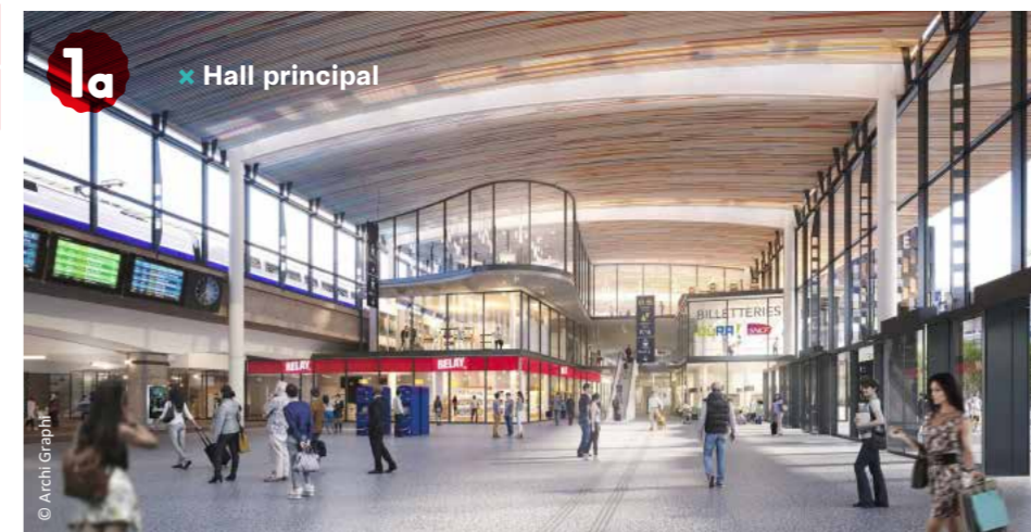
1a ✖ Hall principal